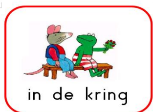
Dagritmekaarten bij kinderdagverblijf Wonderlief

In onze groepen bieden wij structuur, dit geeft kinderen houvast en herkenning en daarmee het gevoel van veiligheid. Wij werken zoveel mogelijk met dagkleuren en dagritmekaarten. Kinderen zijn daardoor in staat controle te krijgen over de dagen, het programma en de tijd. Zo weten de kinderen bijvoorbeeld waar zij aan toe zijn en wanneer het moment is dat papa/mama ze weer op komt halen.