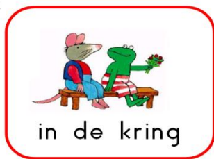
Dagritmekaarten bij kinderdagverblijf Wonderlief

In onze beide stamgroepen (rupsen en vlinders) bieden wij structuur, dit geeft baby's en peuters houvast en herkenning en daarmee het gevoel van veiligheid. Wij werken zoveel mogelijk met dagritmekaarten. Peuters zijn daardoor in staat controle te krijgen over de dagen, het programma en de tijd. Zo weten zij bijvoorbeeld waar zij aan toe zijn en wanneer het moment is dat papa/mama ze weer op komt halen. Voor baby's gelden net even andere eet- en slaapmomenten omdat zij meer rust nodig hebben.